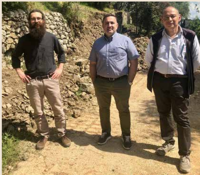
Nella foto alcuni dei promotori dell'iniziativa