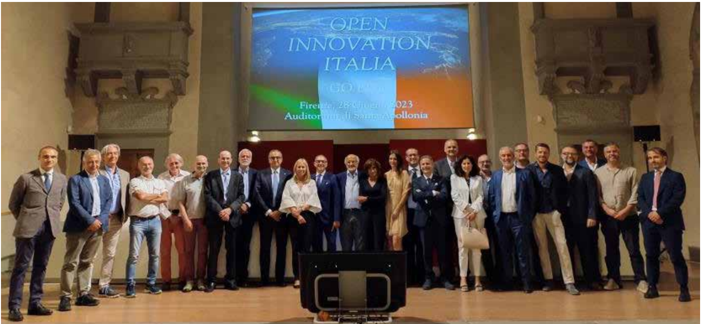
Attimi dell'inaugurazione a Firenze

Fra le attività previste, la Promozione e Organizzazione di Forum annuali tematici, seminari, workshop e realizzazione di partnership/faculty con le Istituzioni. Una collaborazione all'insegna dello sviluppo e dell'integrazione di nuovi approcci e nuove idee provenienti da risorse interne ed esterne con l'ambizione di produrre valori e prodotti/servizi condivisi dalle imprese associate e tutti gli stakeholder, clienti, consumatori inclusi. Importanti i valori di riferimento che prendono spunto dall'esperienza imprenditoriale e umana di Adriano Olivetti.